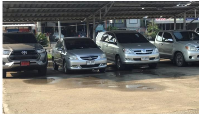
ที่จอดรถยนต์