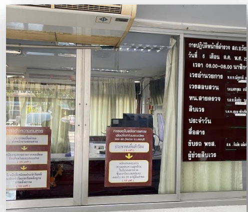
ภาพป้ายประชาสัมพันธ์จุดบริการ One Stop Service