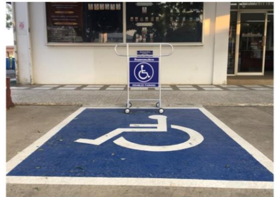
ที่จอดสำหรับคนพิการ

ได้จัดสถานที่สำหรับจอดรถไว้โดยเฉพาะสำหรับผู้มาติดต่อราชการ ได้แก่ รถยนต์ รถจักรยานยนต์ และที่จอดรถสำหรับคนพิการ