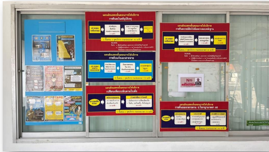
ภาพป้ายพับกระดาษสัญลักษณ์ จุดบริการ One Stop Service