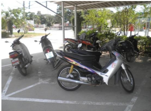
ที่จอดรถจักรยานยนต์