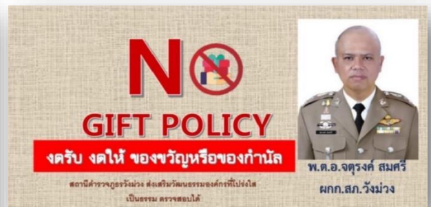
ภาพป้าย No Gift Policy ณ จุดบริการ One Stop Service