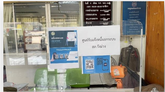
ภาพจุดประชาสัมพันธ์/สอบถามความคืบหน้าการดำเนินคดี ณ จุดบริการ One Stop Service